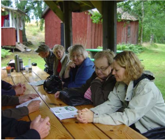
I väntan på lunch