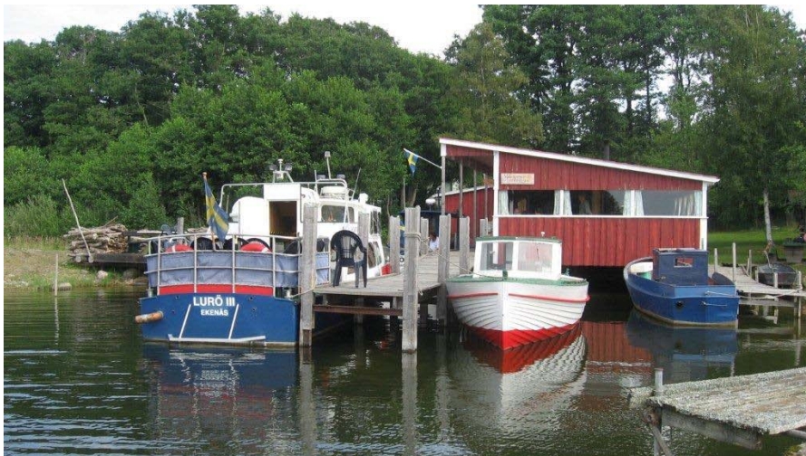
Café Luröbryggan vid Basteviken