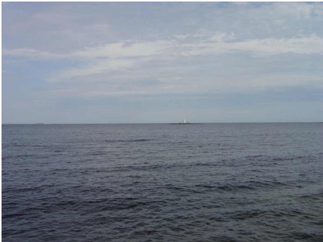
Utsikten från Stångudden