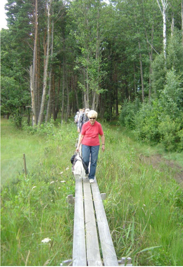
Spångad led över sankmark