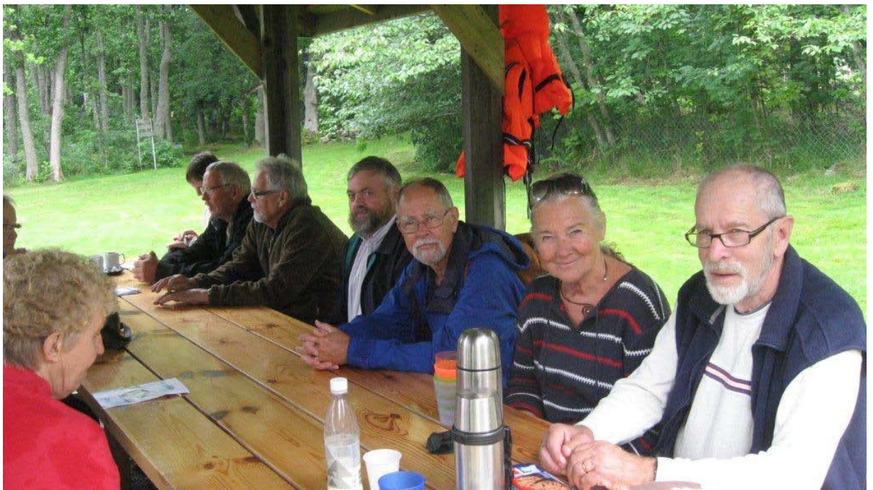
Fler i väntan på lunch