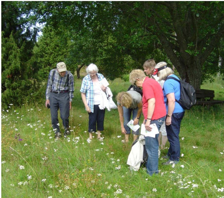
Examination av växter