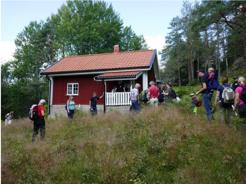
Stugan vid Bastedalen

Bryngel var både läs och skrivkunnig och blev känd både på Dal och i Bohusläns som läkare och trollkarl.