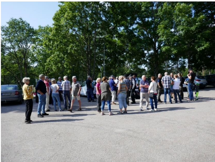
På parkeringen vid kyrkan

Efter samling och avprickning vid Ed:s kyrka åkte vi, ca ett 30 –tal personer i karavan mot Bastedalen Klevmarken i.