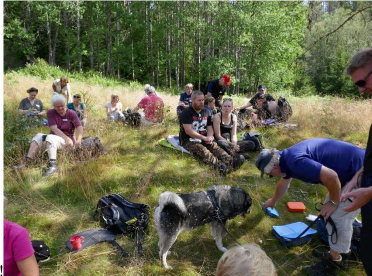
Fikapaus i Bastedalen. Underbart!!

I häftet klevmarkssläkten muntlig tradition finns det mer att läsa . Skrönor eller sanning ? det får var och en avgöra.