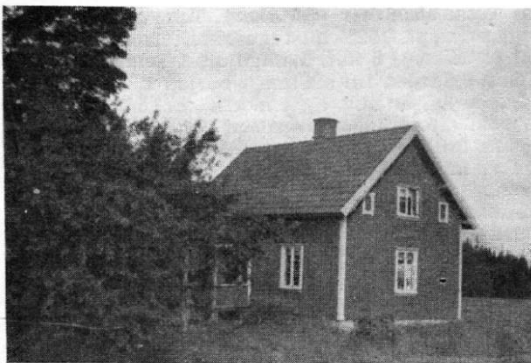
Ur Svenska Gods och Gårdar, Dalsland, Utgåva II 1945

Upplysning: Strövtåg bland ödeställda hemmanslotter och torp finns med i "Klevmarkssläkten. Muntlig tradition. Utgiven av släktföreningen 1998.