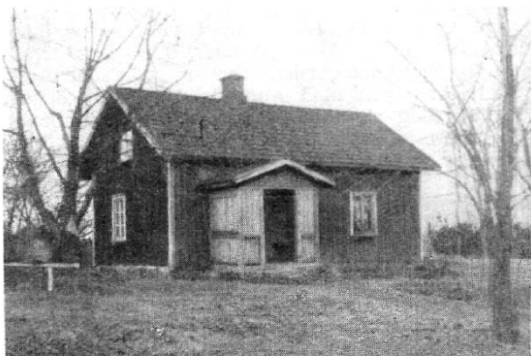
Ur Svenska Gods och Gårdar, Dalsland, Utgåva II 1945