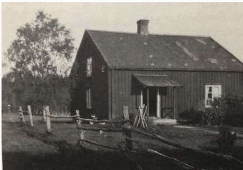
Nordsäter i Klevmarken. Huset som uppfördes i mitten av 1800-talet är nu rivet.