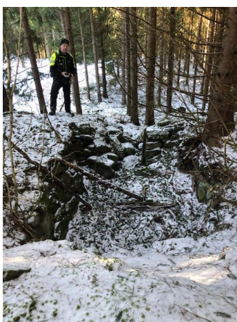
Jordkällare vid Stugulund