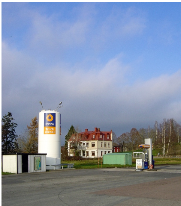
Nya Slängom som huset ser ut idag.

...när väggarna var murade rådde Olof Knape 4 , svåger till min far, att han borde lägga på ännu ett plan, det skulle proportionsvis kosta så lite, och så blev det. Teglet till bygget slogs av lera nere vid älven (Vitalandaån). Fördjupningen efter lertakten använde vi pojkar senare som lägerplats vid kräftfiske. Vi låg då runt en lägereld nere i gropen.