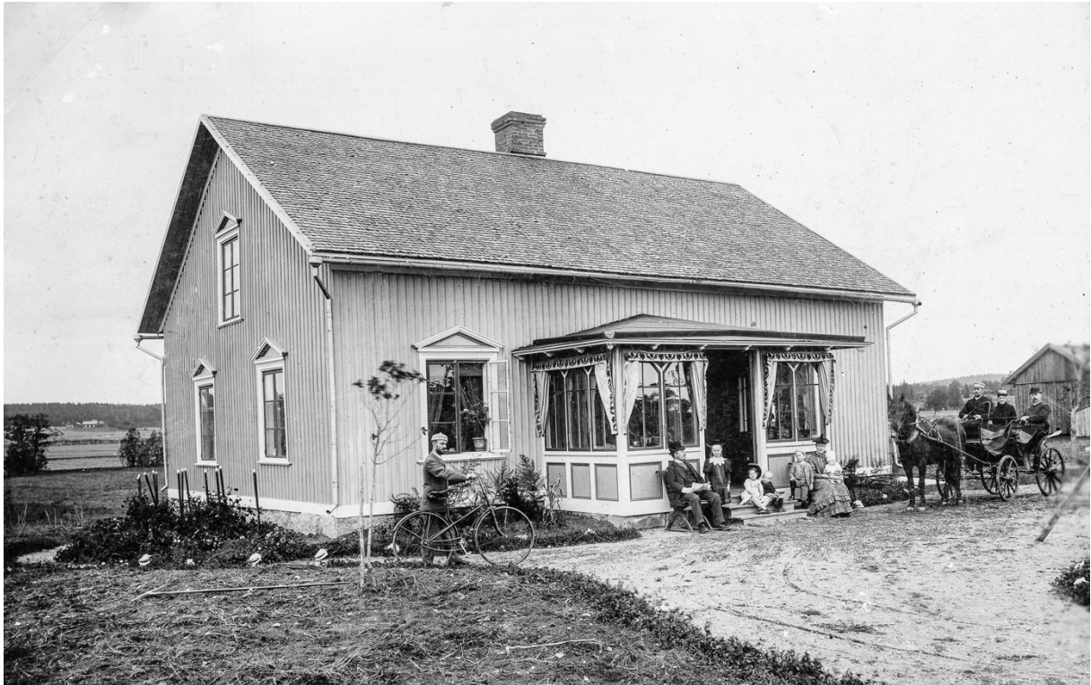
Gamla Slängom. Farfar och farmor sitter i mitten med fem småbarn mellan sig. Bilden är troligen från något av åren före sekelskiftet 1900.